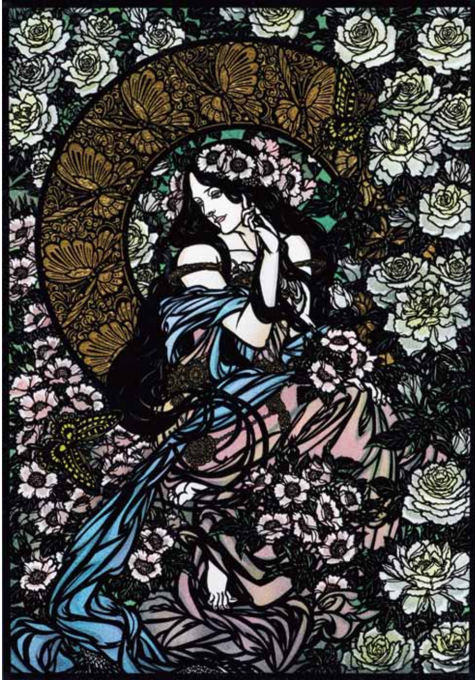
倪瑞良 / 薔薇色の季節

日本を代表する切り絵作家11人が魅せる 繊細で美しく、個性あふれる作品をご覧ください。