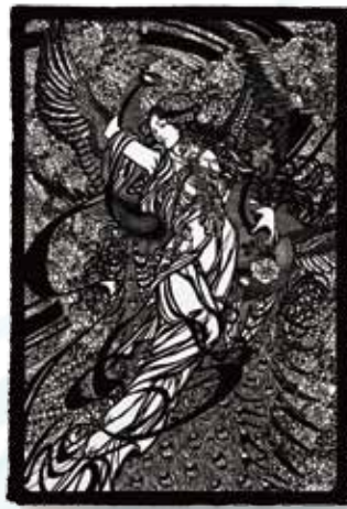
倪瑞良 / 翔々かける