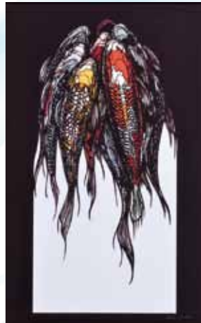
福井利佐 / 鯉2016