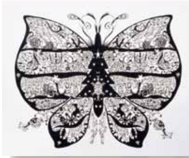
蒼山日菜 / クリスマスシーン