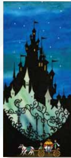
辰己雅章 / シンデレラ