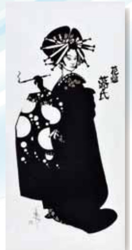
百鬼丸 / 花魁落氏(ふきじ)