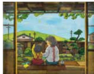
酒井敦美 / 変わらないもの