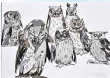
林敬三 / 七人の侍