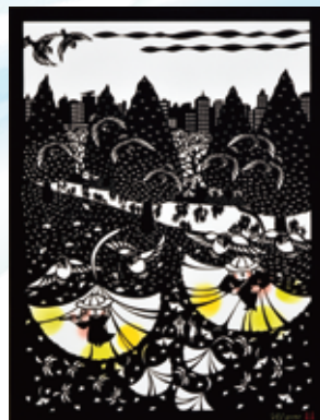
柳沢京子 / 舞い降りる幸せ