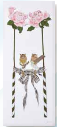
筑紫ゆうな / 無題