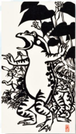
井出文蔵 / 駆けよ子うさぎ