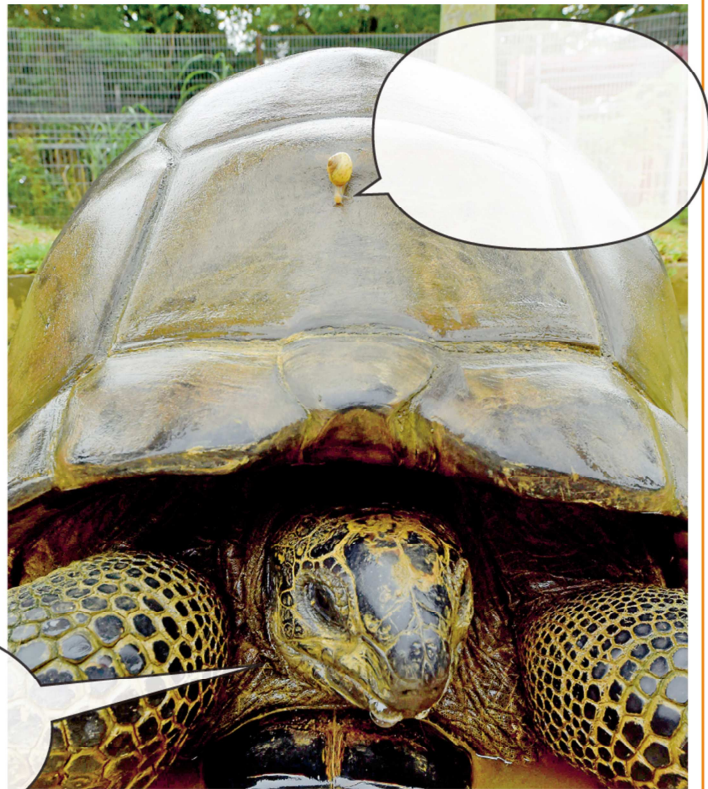
こうら うえ の あめ う 甲羅の上にカタツムリを乗せ、雨に打たれるアルダブラゾ ウガメの「ダチちゃん」【2021年6月18日付琉球新報総合面】

【1】は、見出しにヒントがあるよ。読んでみてね。6月の慰霊の日あたりには終わるよね。【2】は、写真を見て分かるかな? 難しいときには、これも見出しを見て確認してみよう。【3】は、よく見ると書いてあるからね。探してみよう。写真の上かな? 下かな? 【4】は、ゾウガメとカタツムリの気持ちになって考えてみよう!