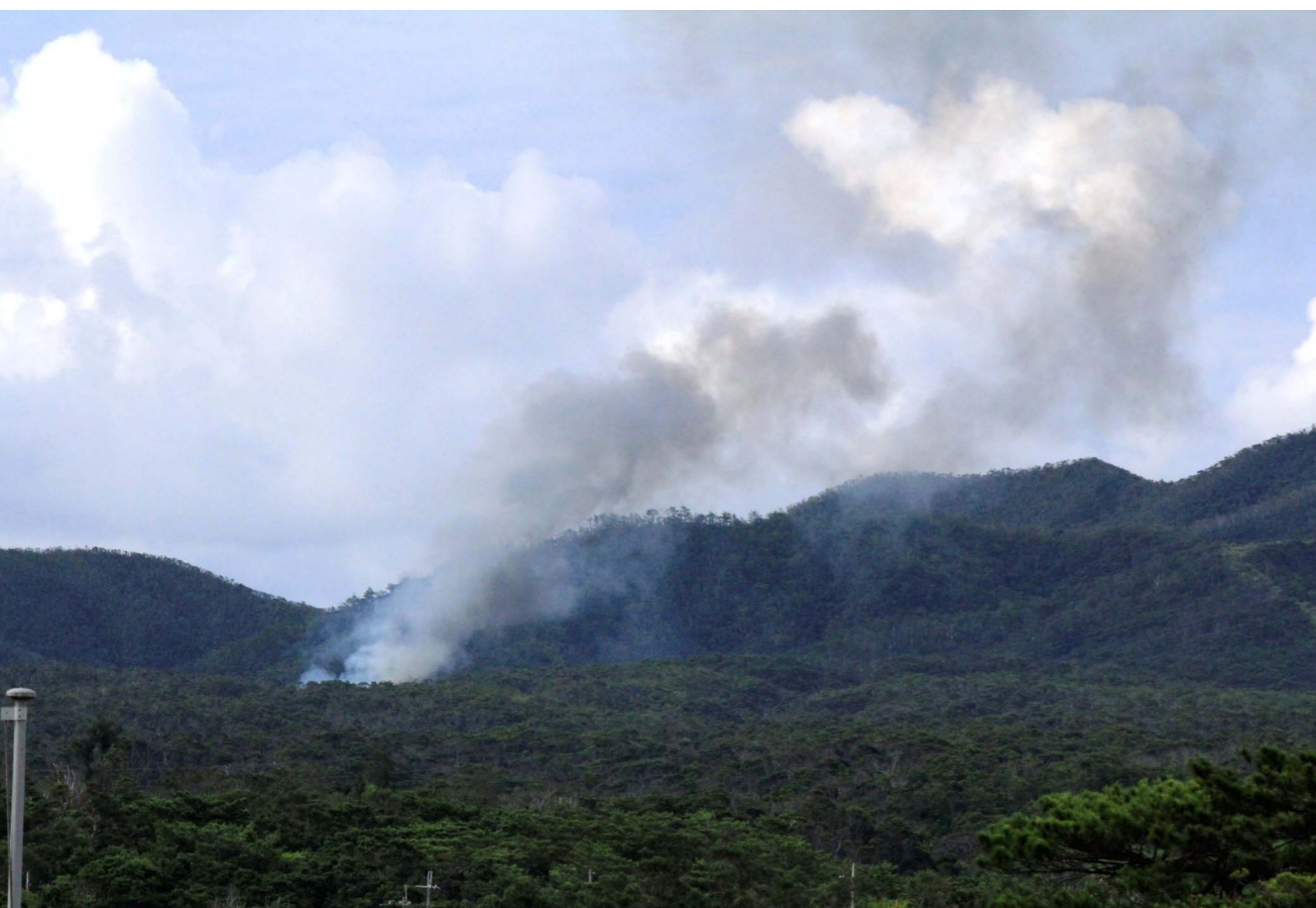
HH60救難ヘリが墜落した場所から上がる黒煙=5日午後4時19分ごろ、宜野座村の米軍キャンプ・ハンセン