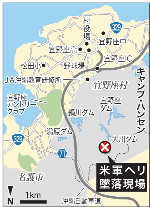
米軍ヘリ墜落現場