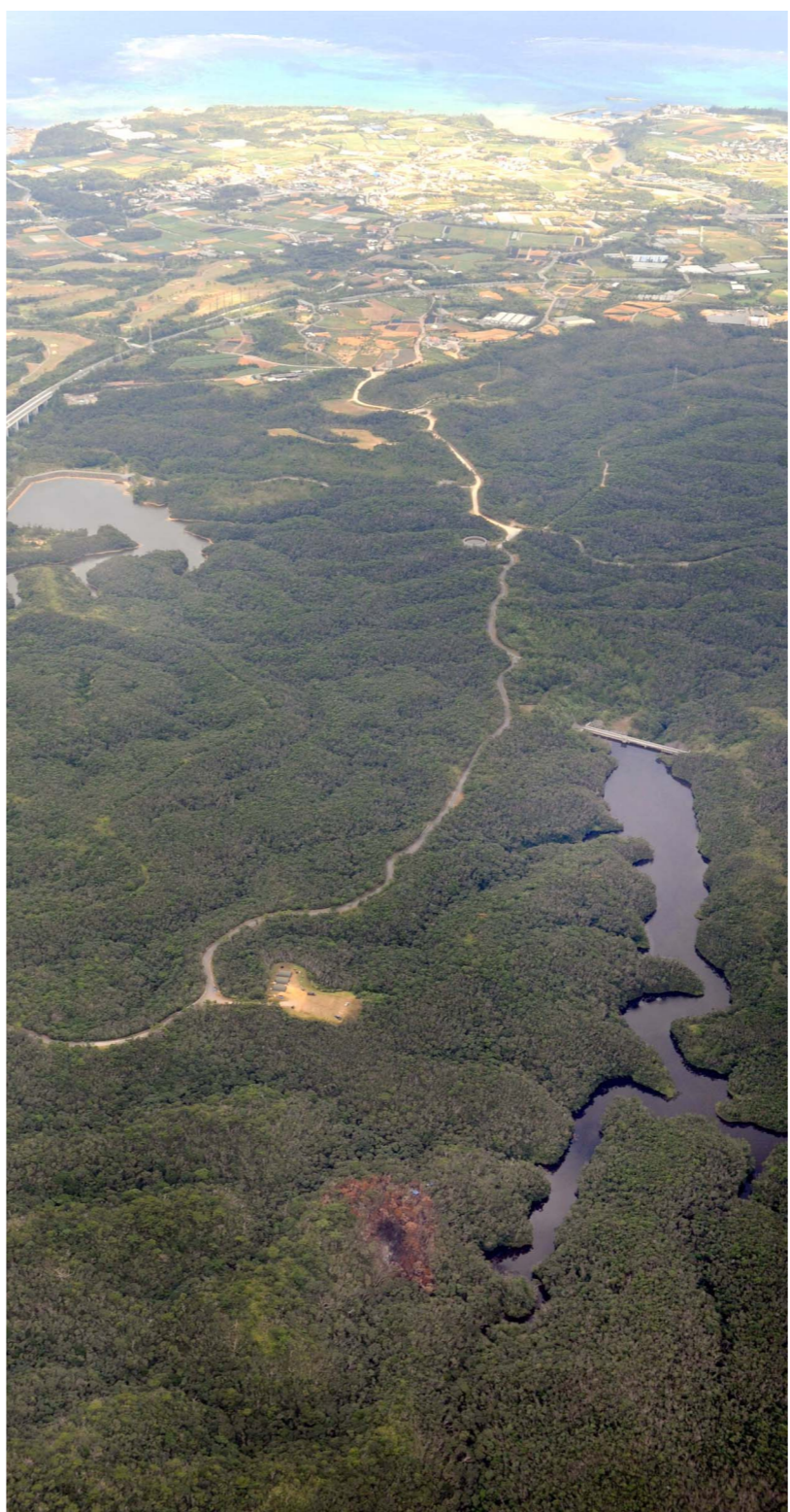
大川ダム(手前)のすぐ近くにHH60ヘリが墜落し、周辺に焼けた跡が見える。奥は宜野座ダム=10日午後2時41分、宜野座村のキャンプ・ハンセン

あわせて大川ダムは、宜野座村民の水がためであり、水質の汚染が懸念されることから、いまだに取水停止の状態である。「水と緑と太陽の里」をキャッチフレーズとして、水の豊かな村づくりを進めるべき宜野座村にとって、村民の命の水がめが汚染されることは、断じて許されるものではない。 また、墜落の危険性が叫ばれているオスプレイの配備に対して、昨年11月1日に「オスプレイ配備に反対し、米軍の墜行を糾弾する」ことを宣言した。オスプレイの強行配備に反対し、米軍の墜行を糾弾する。この際、米軍の超高空飛行や独特の騒音被害が増大し、墜落の危険性を高め、村民に恐怖と不安をもたらしており、これ以上の基地負担については受け入れることができない。 よって、宜野座村民は、ヘリ墜落事故に断固として抗議するとともに、次の事項について強く要求する。 一 日米両政府は、事故の原因究明と再発防止策を速やかに公表し、それまでの間、同機種の飛行を中止すること。 一 日米両政府は、事故に係る損害を補償すること。 一 日米両政府は、安全性等の確認のために立ち入り調査を認めること。 一 日米両政府は、オスプレイを