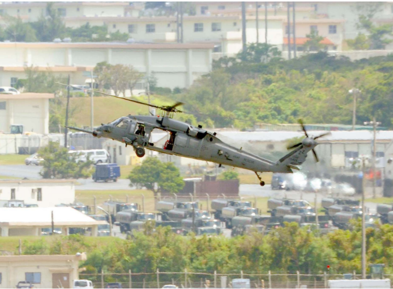
墜落事故から11日目、事故原因が究明されないまま飛行を再開した事故機と同型のHH60救難ヘリ=16日午後1時48分、米軍嘉手納基地