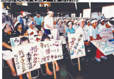
小丘のヘリパッド建設と催涙ガス放射事件に抗議する「ヘリパッド建設即時中止村民総決起大会」が開催

大砲けん引車の方向転換で畑被害 1992.2 (軍用地境界) フェンス施設工事で自然破壊 92.3.7 (宜野座) 米軍ヘリが宜野座ダム付近で着陸後に横転。プロペラの一部が約450m先の大川ダムへ飛散 92.3.19 (惣慶) 大規模野営訓練で赤土汚染 92.5.10 (松田) 戦車道拡幅工事で自然破壊 1993.6.25 (松田) 米軍演習車が水道管破壊 1994.4 (松田) 野戦用訓練施設が完成 94.6.15 (宜野座) 宜野座ダムで米兵がボートを使用 94.12.20 (漢那) 米軍演習車による畑被害 1995.2.23 (惣慶) 米軍演習車による畑被害 95.3.12 (漢那) 米軍車両による人身事故で6歳の男児が亡くなる 95.8.21 (漢那) 爆弾積載車両が住宅侵入、騒音被害 1996.1.25 (松田) 無線局設置で国道329号規制 96.4.15 (漢那) 米軍が茶畑出入り口封鎖 96.6.11 (漢那) 米軍ヘリ訓練による騒音被害 96.12.3 (惣慶) 演習で村ごみ捨て場職員の出勤妨害 1997.7.4 (惣慶) 米軍ヘリ訓練による騒音被害 97.12.4 (松田) 高松軍用地進入道で演習 1998.2.9 (城原) 米軍大型車両が区内を通行 98.5.20 (漢那ダム) 集水域上流の露地から赤土流出 98.7.23 (惣慶山) 米軍ヘリが墜落 2000.4.27 (松田) 水陸両用車がサンゴ破壊 2001.5.25 (宜野座) 国道で米軍トラクター同士の追突事故で交通渋滞 01.8.27~28 (松田) 米軍ヘリ訓練による騒音被害 2002.4.7 (松田)