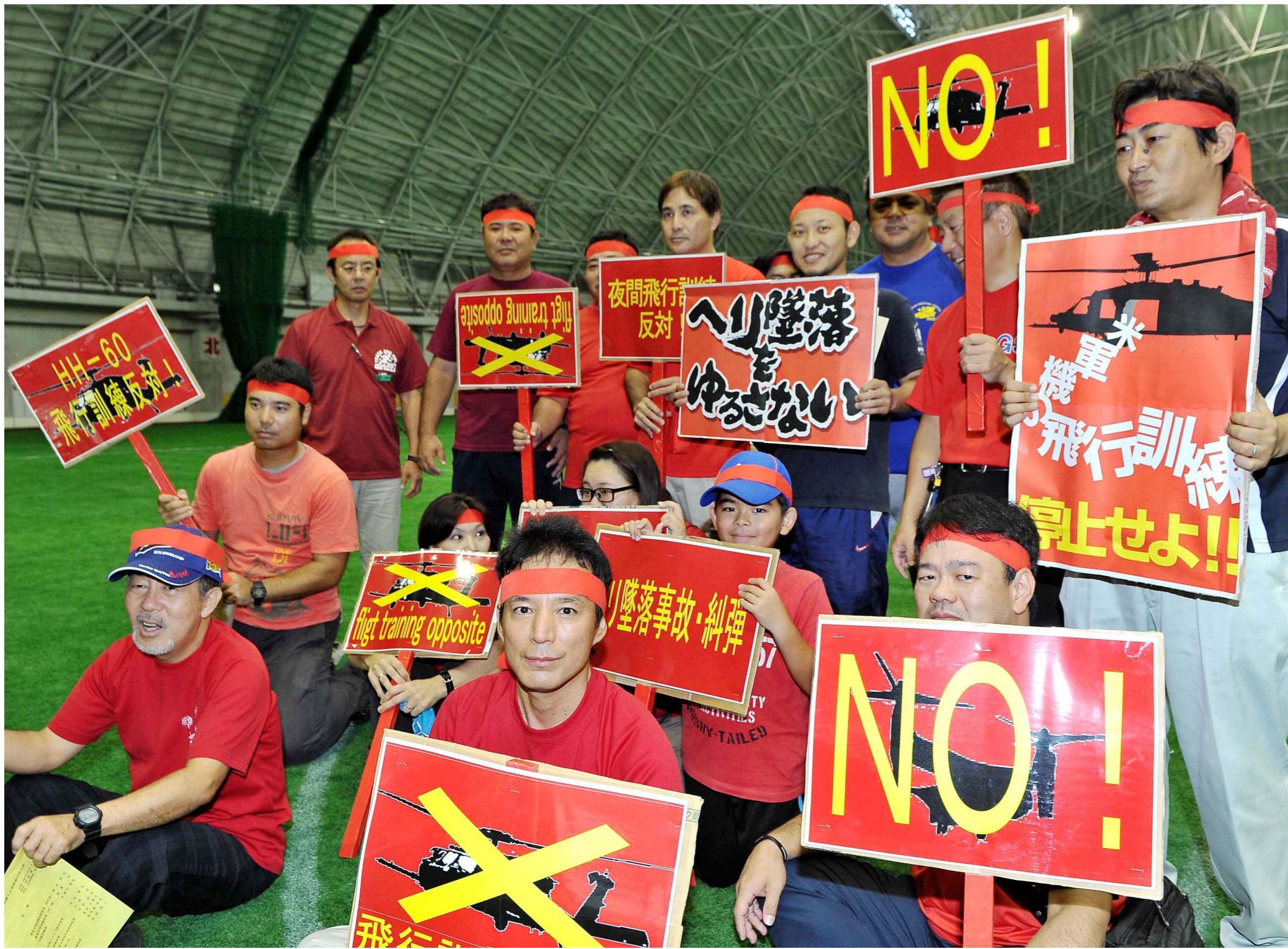
米軍ヘリ墜落に抗議する大会参加者ら。22日午後、宜野座村の宜野座ドーム

【宜野座】5日に発生した米軍ヘリ宜野座墜落事故に抗議する宜野座村民大会が22日午後6時半から、同村宜野座ドームで開かれた。宜野座村をはじめ、金武町や恩納村などから多数の住民が集結し、事故に強く抗議した。大会では、事故の原因究明と再発防止策が講じられるまで同機種種の飛行を中止することや損害の補償、立ち入り調査の承認、オスプレイの全機撤収—を求める決議を採択する。