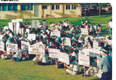
1990.4 (惣慶) 都市型訓練施設完成 1991.9.3 (惣慶)

1988.7.23 (松田) 米兵が農道で空砲を乱射 88.7.28 (宜野座) 米兵が宜野座ダム内で遊泳 88.8.2 (松田) OV10ブロンコ観測機が民間地を低空飛行し騒音をまき散らす 88.8.26 (松田) 米軍車両が湯原地内を踏み荒らす 1989.2.15 (惣慶) 米軍車両が民間地を踏み荒らす 89.5.6 惣慶区と福山区主催の都市型戦闘訓練施設建設反対村民総決起大会 89.6.5 (惣慶) 都市型訓練施設の工事着工 89.6.20 福山主催の「都市型戦闘訓練施設建設反対村民総決起大会」開催