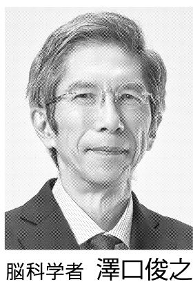
脳科学者 澤口俊之

GABAは人間の脳内にも存在し、緊張やストレスなどを和らげる働きがあると言われています。多くの人は身体が疲れているというより、脳に疲労がたまっている事が多いのです。さらに現代はスマホやPCなど