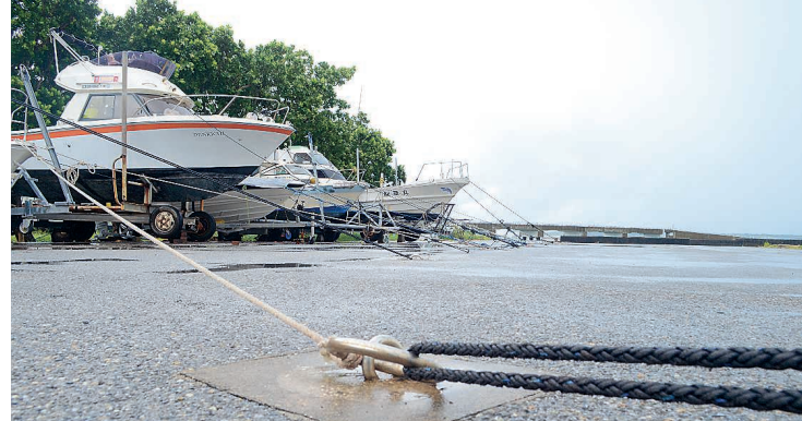
台風3号の接近に備え、ロープで固定された船舶=23日午前11時50分ごろ、宮古島市平良の荷川取漁港